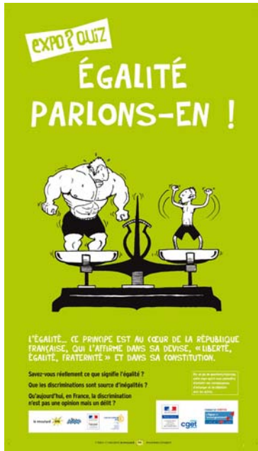
ÉGALITÉ, PARLONS-EN !