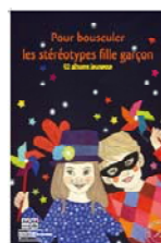
"Pour bousculer les stéréotypes fille garçon" (2013)