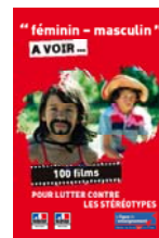
"Féminin - masculin, 100 films pour lutter contre les stéréotypes" (2014)