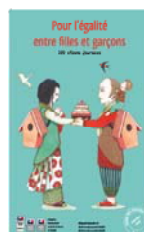
"Pour l'égalité entre filles et garçons, 100 albums jeunesse" (2009)

À noter : Certaines productions éditoriales, certains films, perpétuent les stéréotypes et les nourrissent. Ces bibliographies réalisées par l'Atelier des merveilles (Le Teil, Ardèche) et cette filmographie réalisée par la Fédération des oeuvres laïques de la Drôme, ont pour but d'aider les parents, les enseignants et les médiateurs à trouver des outils pour réfléchir avec les jeunes aux stéréotypes et aux représentations des femmes et des hommes, vers plus d'égalité. Accédez aux documents en version "pdf" grâce aux flashs codes.