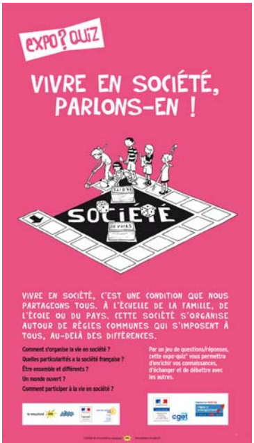
VIVRE EN SOCIÉTÉ, PARLONS-EN !