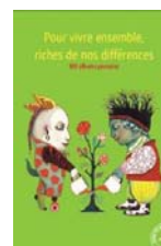
"Pour vivre ensemble riche de nos différences" (2011)