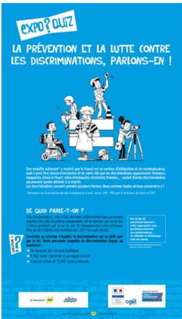
LA PRÉVENTION ET LA LUTTE CONTRE LES DISCRIMINATIONS, PARLONS-EN !

Pour plus d'informations sur ces outils de réflexion et de débats, contactez : La Fédération de la Ligue de l'enseignement de la Sarthe 02 43 39 27 27